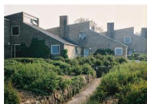
アルネ・ヤコブセン集合住宅