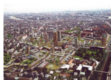
敷地内に7棟の高層建築が出来る