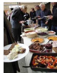
協同作業後の昼食