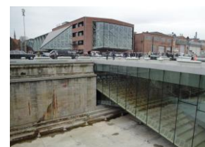
Big 設計 海運博物館