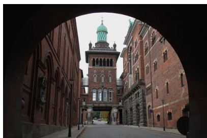
象の門は観光名所

カールスベアは世界的に有名なデンマークビールです。コンペで決められた計画案に基いての計画が が進められていますがその計画の内容と観光的に有名な『象の門』のあたりの話をさせていただきます。