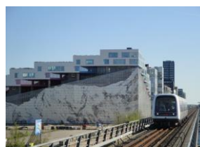
Big 設計 マウンティン