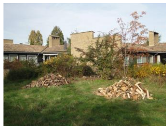
敷地内の樹木は薪となる