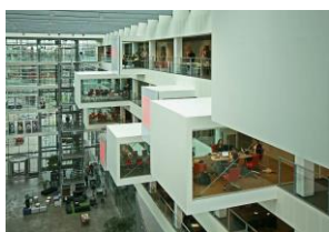
ヘニング・ラーセン IT 大学

デンマークで世界的には有名なヨン・ウツソン、アルネ・ヤコブセン、ヘニン・グラセンの話や 現在、北欧で最も注目されている Big グループの活躍と海運博物館の話をいたします。