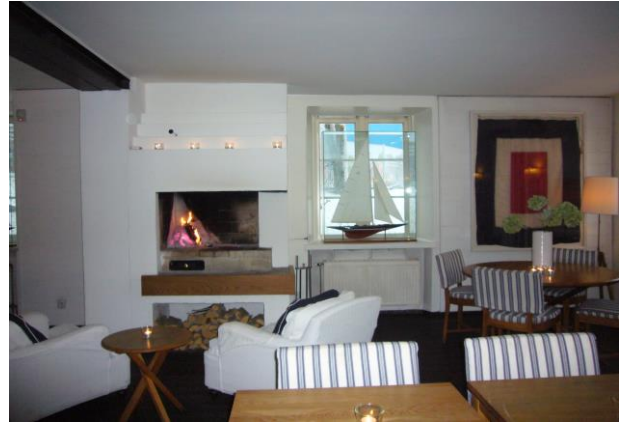
ホテルJのラウンジ