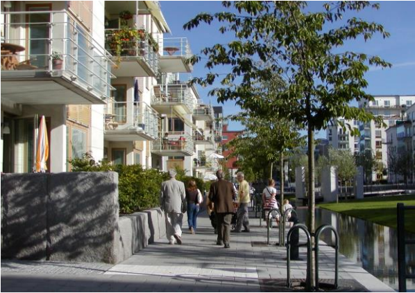
ハンマルビーのメインストリート