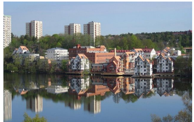
ヤーラの低層集合住宅 (Google E)