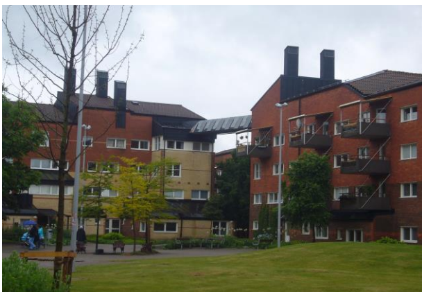
ユニークなスカイラインのスカulpturkullen