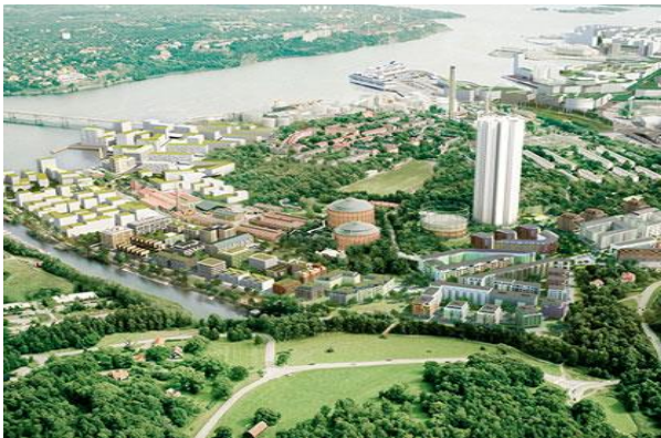
ロイヤルシーポートの住環境 (ストックホルム市)