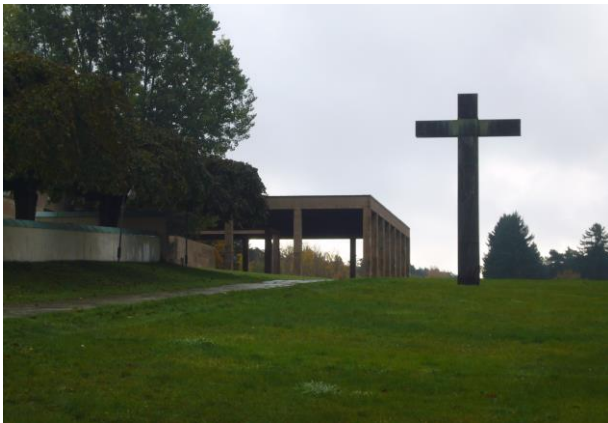
世界遺産指定の森の葬祭場 アスプルンド設計