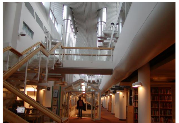
ストックホルム大学図書館 ラルフ・アースキン設計